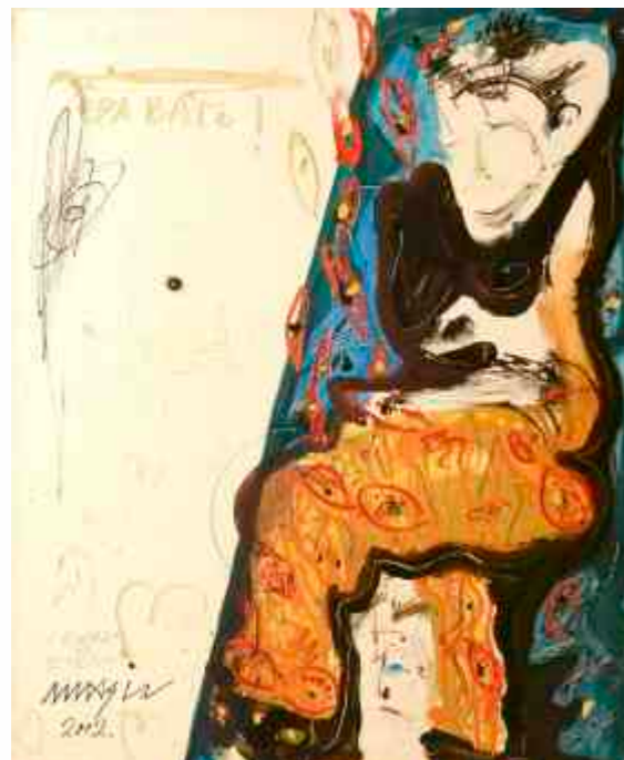
Miroslav Masin (Makedonija) ulje na platnu / 110 x 90 cm / 2002.