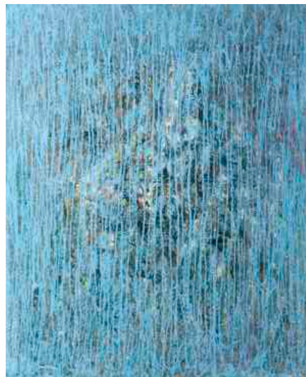
Nevenka Stojsavljević (Srbija) ulje na platnu / 110 x 90 cm / 2001.

Iz fonda Međunarodne likovne kolonije „Buljarica Art”