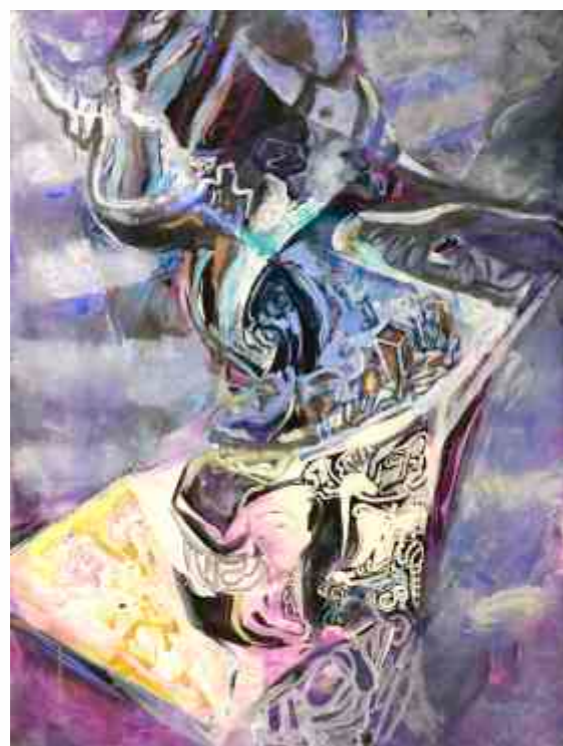
Milorad – Bata Mihailović (Srbija) ulje na platnu / 130 x 97 cm / 1977.