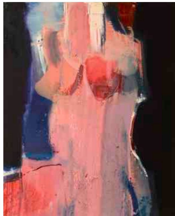
Dik Roberts (SAD) kombinovana tehnika / 110 x 90 cm / 2007.

Zadnja strana – Gligor Čemerski (Makedonija) ulje na platnu / 180 x 90 cm / 2008.